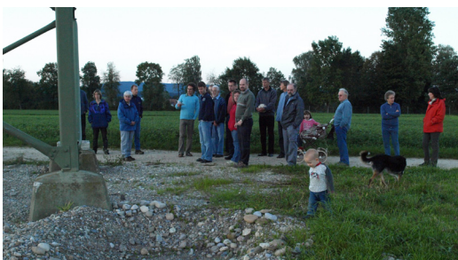
Hofrundgang Biobetrieb mit Vernetzungselementen