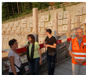
Besuch Tunnelbaustelle Eppenberg