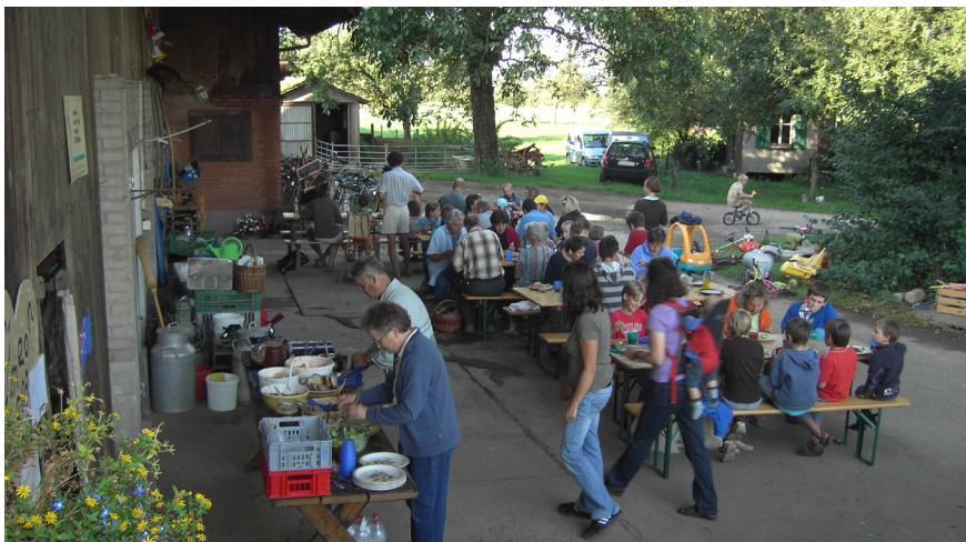
Ausklang Familientag auf dem Mattenhof

Zur Förderung des Zusammenhaltes unter den Mitgliedern und Freunden findet jedes Jahr ein Familientag statt. Meistens wird er in zwei Teilen durchgeführt und beginnt mit einer Besichtigung. So wurden in den vergangenen Jahren folgende Institutionen, Betriebe oder Orte besucht: Kläranlage, Wasserreservoir, Dorfmuseum, Logistiker, Entsorger, SMDK, Schule, Schwimmbad, Bahnhof, Photovoltaikanlage, Tunnelbaustelle Eppenberg, Gletschermoräne, dörfliches Gewerbe usw. Im zweiten und geselligen Teil wird meistens grilliert, die Gemeinschaft ausgiebig gepflegt sowie Politisches und Persönliches ausgetauscht.