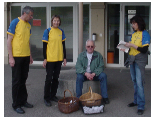
2010: Unterschriftensammlung für arbeitsfreien Sonntag

Ein gutes Echo bei der Bevölkerung finden immer unsere Themenanlässe und Vorträge in der Aula der Schule oder im Kirchgemeindehaus Arche. Beispiele: Entwicklung des öffentlichen Verkehrs, Heizen mit Holz und Sonne, Photovoltaik, Klimaveränderung und Klimaschutz oder Fristenlösung etc..